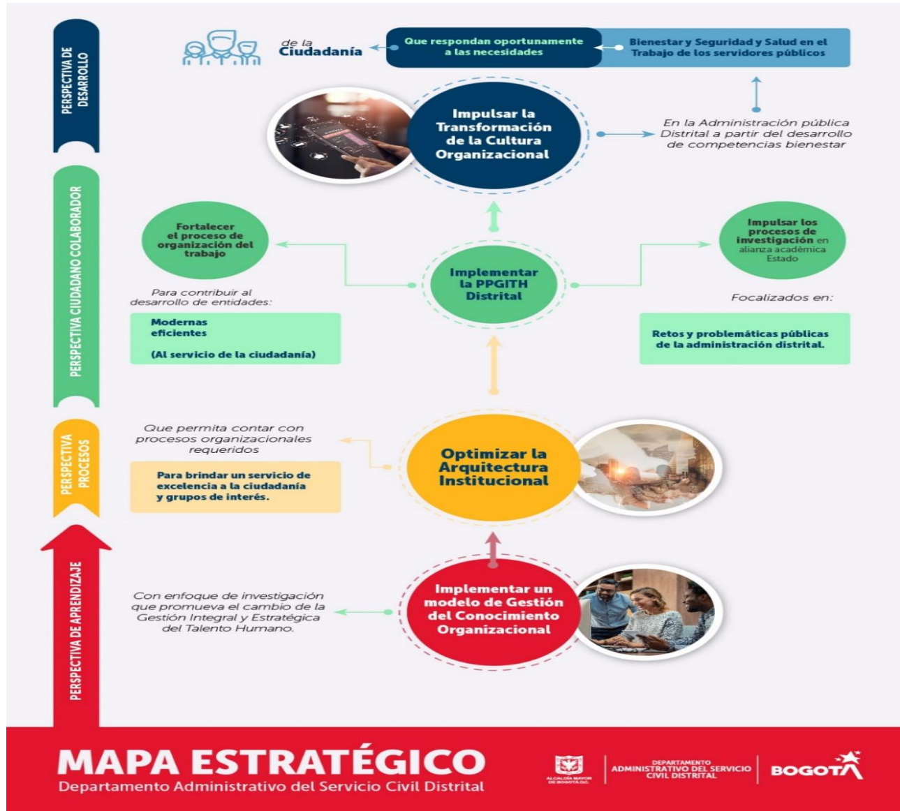
MAPA ESTRATÉGICO MAPA ESTRATÉGICO

El Departamento Administrativo del Servicio Civil Distrital, adopta los siguientes objetivos estratégicos, los cuales están divididos en cuatro perspectivas estratégicas, como propósito para alcanzar metas y estrategias en el marco del Plan Desarrollo vigencia 2020 - 2024: