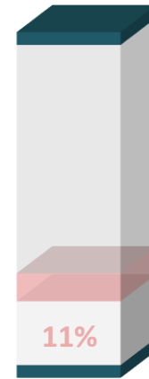
SOLICITUD DE ACCESO A LA INFORMACIÓN - 7