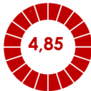
Tiempo promedio de respuesta en días