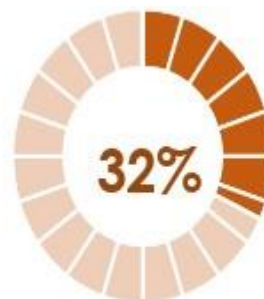
Enero - 490

En el mes de Enero debían atenderse 1.551 PQRSDf, que corresponden a radicados recibidos en: noviembre, diciembre y enero. En conformidad a los términos de la Ley 1755 de 2015, la gestión de estos requerimientos con corte a 31 de Enero de 2023 fue: