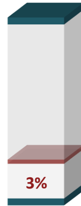
CONSULTA - 2