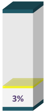
DERECHO DE PETICIÓN DE INTERÉS GENERAL - 2