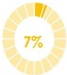
Noviembre - 110