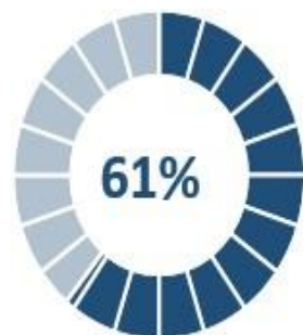
Diciembre - 951