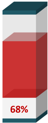
DERECHO DE PETICIÓN DE INTERÉS PARTICULAR - 45